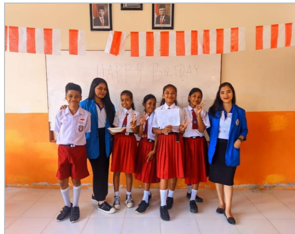
Gambar 3. Dokumentasi bersama sebagian siswa Kelas VI SD Negeri Hatalai

Meskipun kegiatan telah selesai, masih banyak upaya yang perlu dilakukan untuk memaksimalkan kesadaran terhadap bullying secara umum. Siswa sekolah dasar masih kesulitan memahami terminologi asing yang digunakan untuk mengkategorikan perilaku bullying . Namun, penggunaan terminologi asing memudahkan untuk membentuk perilaku penindasan yang tampak tidak sopan dan tidak senonoh, sehingga membuat sosialisasi penindasan menjadi sulit.