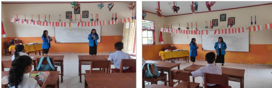
Gambar 2. Sosialisasi bullying dan upaya mengatasinya

Kegiatan pengabdian dengan tema memperkenalkan dan mencegah perilaku bullying pada siswa yang dilakukan di SD Negeri Hatalai, berlangsung pada hari jumat 1 Desember 2023 dan melibatkan siswa kelas 6. Sebelum melaksanakan kegiatan sosialisasi, kelompok pengabdian telah berkonsultasi dengan guru wali kelas dan dosen pembimbing KKN terkait dengan kegiatan dimaksud.