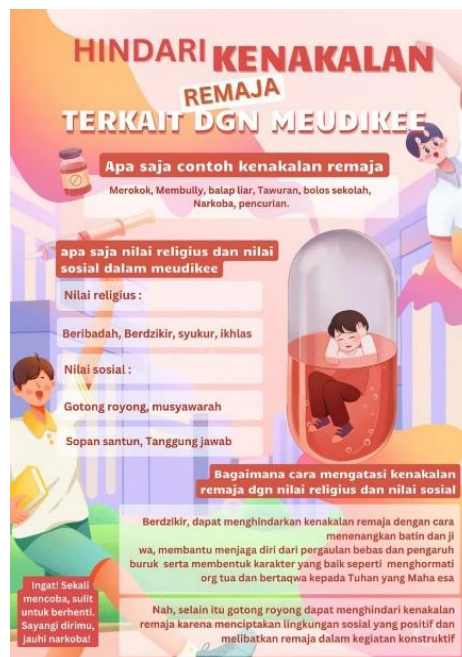
Gambar 2. Hasil poster siswa.

Siswa yang telah dibagi ke dalam beberapa kelompok mendiskusikan masalah kenakalan remaja dan mencari solusi agar perilaku tersebut dapat dihindari. Hasil diskusi kemudian dituangkan dalam bentuk poster kelompok. Proses diskusi kelompok membantu siswa mengembangkan kemampuan komunikasi, kerja sama, dan tanggung jawab sosial dalam pembelajaran. Kegiatan kolaboratif seperti diskusi kelompok juga mampu meningkatkan partisipasi aktif siswa dalam proses belajar. Rahman dan Fitriani (2023) menjelaskan bahwa pembelajaran kolaboratif dapat meningkatkan kemampuan komunikasi sosial, kerja sama, dan kemampuan menyampaikan pendapat peserta didik secara lebih aktif. Hasil diskusi kelompok mereka buat dalam bentuk poster seperti gambar berikut ini: