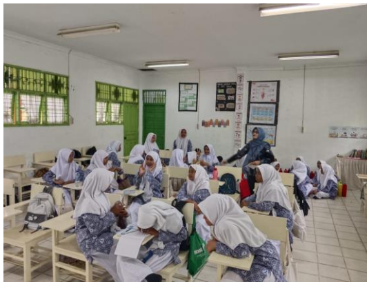
Gambar 4. Siswa dibimbing dalam menentukan melodi dari syair yang telah diciptakan.

Selanjutnya siswa bersama kelompok menentukan melodi atau irama yang sesuai dengan syair meudike yang telah dibuat. Setiap kelompok melakukan latihan bersama untuk menyelaraskan syair dengan irama yang dipilih. Kegiatan ini membantu siswa mengembangkan kemampuan musikal, kekompakan, dan rasa percaya diri dalam menampilkan karya seni secara berkelompok. Pembelajaran musik berbasis kolaborasi dinilai mampu meningkatkan keterampilan sosial dan kemampuan apresiasi seni peserta didik. Menurut Utami & Kurniawan (2021), pembelajaran musik secara berkelompok dapat memperkuat kemampuan kerja sama dan meningkatkan keterampilan musikal siswa melalui pengalaman praktik langsung.