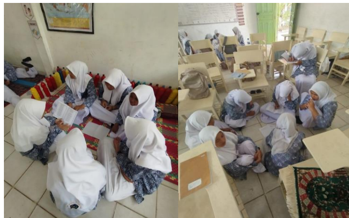
Gambar 3. Siswa bersama dengan kelompok berdiskusi dalam menciptakan syair meudike .

Bak wate malam tanyoe sembahyang Mita amalan geutanyoe dumna Bak jameun jinoe jameun ka ache Beuna sembahyang limong wate Teuma yang kephon ingat keu Tuhan Kedua taulan ingat keu desya Teuma nyan keulhee ingat keu mate Geutanyoe tawoe ta tinggai Donya Teuma yang limong ingat akhirat Hana trep lambat taduek lam Donya Sabda Nabi janjungan alam Geukheun sembahyang tameng Agama