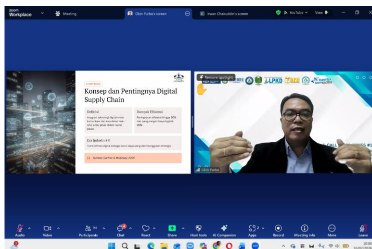
Gambar 2. Pelaksanaan Webinar PKM Nasional.