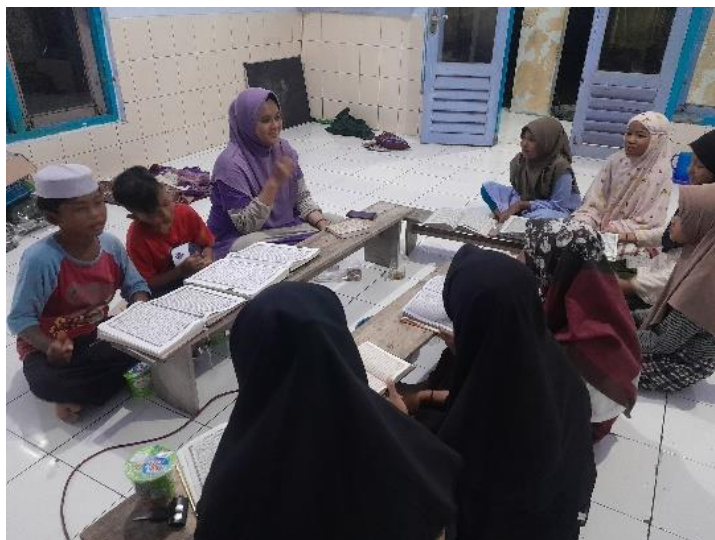
Gambar 1. Uztadzah Mengajarkan Struktur Kalimat Bahasa Arab dan Bahasa Indonesia

Gambar diatas menunjukkan bahwa tantangan terbesar dalam mengajarkan bahasa Arab kepada santri adalah kecenderungan mereka untuk menerapkan pola bahasa Indonesia dalam menyusun kalimat bahasa Arab. Oleh karena itu, beliau menekankan pentingnya latihan intensif dalam membedakan struktur kalimat antara kedua bahasa serta pemahaman konsep i'rab secara mendalam agar santri dapat menyusun kalimat bahasa Arab dengan benar. Melalui penelitian ini, dapat disimpulkan bahwa strategi pembelajaran berbasis perbandingan struktur kalimat dan penggunaan media visual sangat efektif dalam membantu santri memahami sintaksis bahasa Arab. Dengan latihan yang berulang dan bimbingan yang sistematis, santri di Mushollah Zubhatul Hasan dapat lebih mudah beradaptasi dengan aturan bahasa Arab yang berbeda dari bahasa Indonesia.