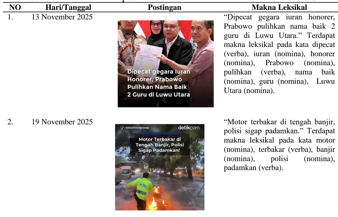
Tabel 1. Makna Leksikal pada Judul Berita Detik.com Edisi November 2025.