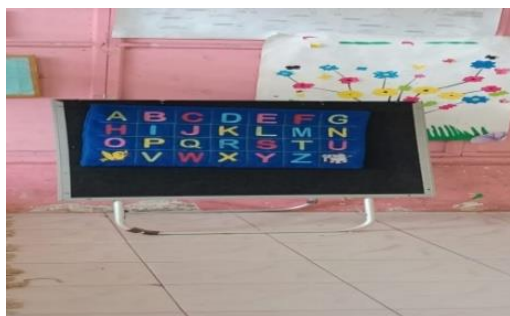
Gambar 5. Papan Huruf.

sangat krusial dalam tahapan awal membaca dan menulis. Temuan data ini diperkuat oleh studi dokumentasi yang ditemukan pada tanggal 3 November 2025 dan 17 November 2025, sebagai berikut: