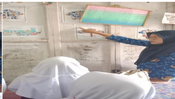
Gambar 8. Siswa membaca kalimat bergilir.

Gambar diatas memperlihatkan guru menerapkan membaca bergilir kepada siswanya, guru memandu setiap siswa dalam memahami pembelajaran. Siswa secara tertib membaca secara bergiliran sesuai perintah dari guru.