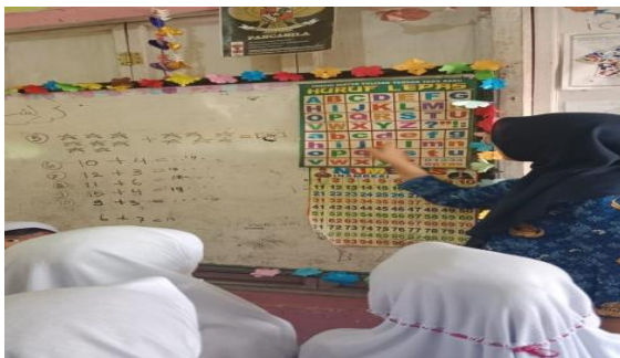
Gambar 7. Siswa membaca Huruf bergilir.

Wawancara dengan guru wali kelas menegaskan bahwa metode membaca bergilir merupakan strategi pribadi guru untuk meningkatkan literasi. Guru menggunakan metode ini bersamaan dengan pemberian reward untuk memotivasi siswa agar tetap fokus dan menyimak giliran teman mereka. Bagi guru, membaca bergilir adalah upaya efektif untuk memastikan partisipasi aktif siswa (membaca) dan mendorong perilaku menyimak. Tantangan yang dihadapi guru adalah transisi dari kemampuan membaca lisan (mambaca) menuju kemampuan pemahaman (memaham). Temuan data ini diperkuat oleh studi dokumentasi yang ditemukan pada 17 November 2025, sebagai berikut: