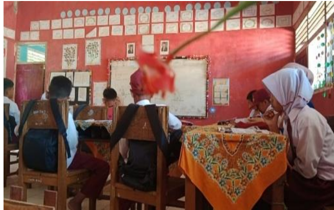
Gambar 1. Siswa membaca materi.

Pada hasil wawancara yang telah dilakukan peneliti dengan guru wali kelas ditemukan bahwasanya guru tersebut membebaskan kepada siswa untuk memilih apa yang mau mereka baca dan guru juga menggali pemahaman siswa dari apa yang mereka baca dan setelah itu guru baru menjelaskan apa yang tidak dimengerti siswa. Temuan data ini diperkuat oleh studi dokumentasi yang ditemukan pada tanggal 3 November 2025, sebagai berikut: