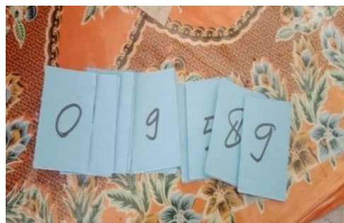
Gambar 6. Kartu kata.

Media pembelajaran diatas yaitu berupa papan huruf dan kartu huruf yang digunakan guru sebagai alat bantu dalam menjelaskan pembelajaran. Media ini sangat mendukung dalam belajar yang membuat anak lebih bersemangat.