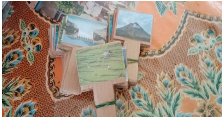
Gambar 4. Papan Gambar.

Strategi bermain kata mencakup permainan memori (mengulang kata) dan permainan menyusun/membaca (menggabungkan kartu huruf). Keduanya merupakan upaya yang terencana untuk meningkatkan kemampuan pemahaman lisan, fokus, dan pengenalan kata.