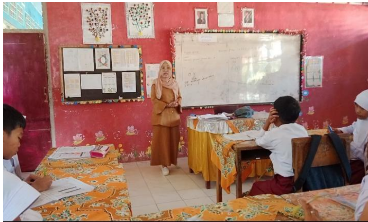
Gambar 2. Siswa menceritakan kembali bacaan.

meskipun terdapat variasi dalam cara siswa menyampaikan (menghafal atau memahami). Temuan data ini diperkuat oleh studi dokumentasi yang ditemukan pada tanggal 3 November 2025, sebagai berikut: